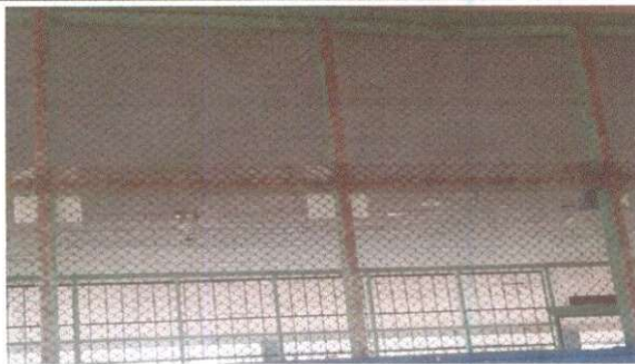
Foto 5: Fabricación e instalación de balcones de hierro en ventanas