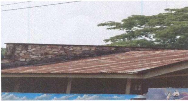
Foto1: Sustrucción de lámina, por lámina troquelada aluzinc calibre 26