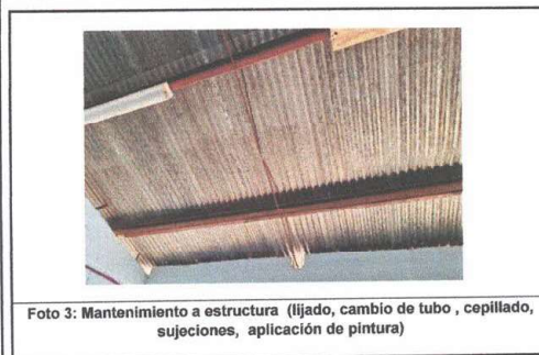
Foto 3: Mantenimiento a estructura (lijado, cambio de tubo, cepillado, sujeciones, aplicación de pintura)