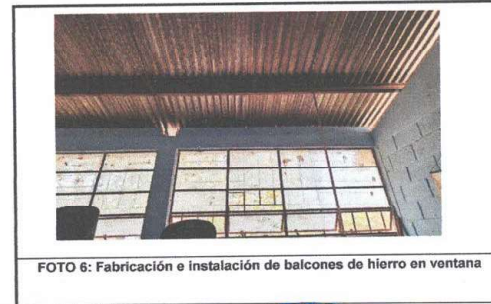
Foto 6: Fabricación e instalación de balcones de hierro en ventana

Observación: Si es necesario se pueden agregar hojas adicionales y actualizar el número de hojas.