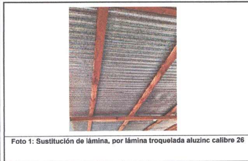
Foto 1: Sustrucción de lámina, por lámina troquelada aluzinc calibre 26