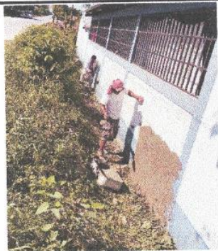
Foto 5: Mejoramiento de drenaje por filtración de agua en salón de clases