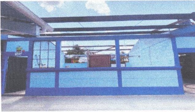
Foto1: Cambio de Techo