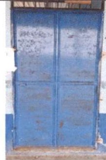
Foto 4: Mantenimiento a estructura (lijado, cambio de tubo, cepillado, sujeciones, aplicación de pintura) (Puerta)