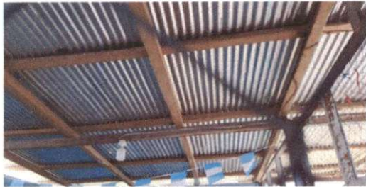
Foto 3: Sustitución de estructura de soporte de madera, por metal