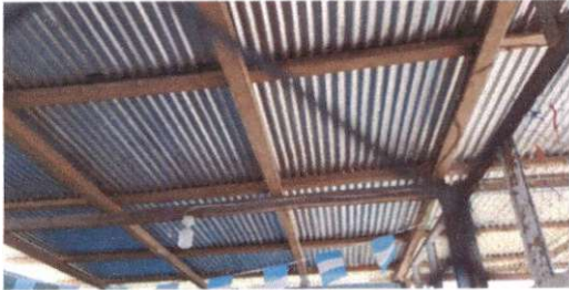
Foto 1: Sustitución de lámina, por lámina troquelada aluzinc calibre 26