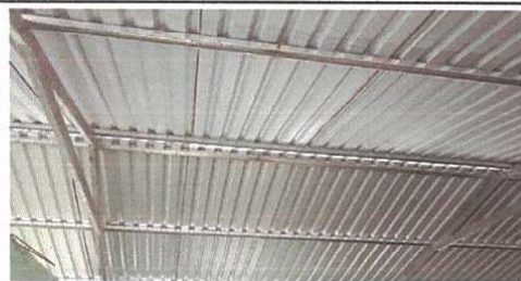
Sustitución de lámina por lámina troquelada