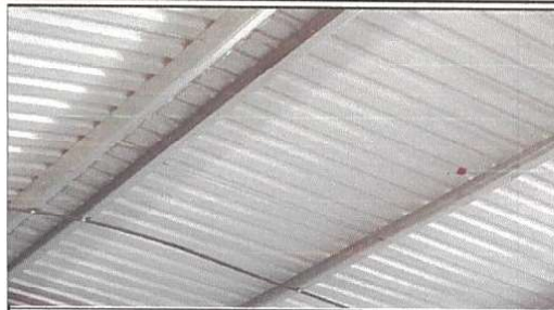
sustitución de ducto electrico + accesorios