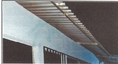
Sustitución de estructura de madera, por metal