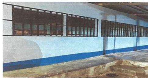
Sustitucion de ventanas de madera por metal