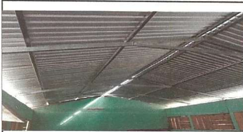
Sustitución de lámina troquelada aluzinc calibre 26