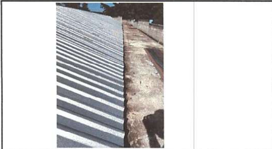
Foto1: SUSTITUCIÓN LÁMINA Renglón 1.1