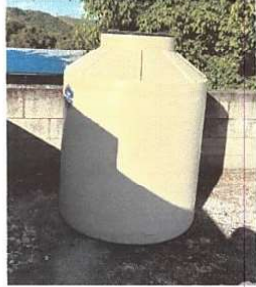
Foto1: SUSTTUCIÓN DEPOSITO DE AGUA Renglón 18.2