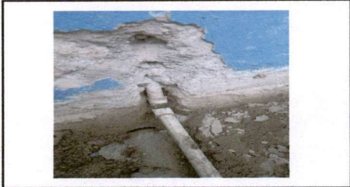
SUSTITUCION DE TUBERIA PRINCIPAL ( RED DE AGUA POTABLE)