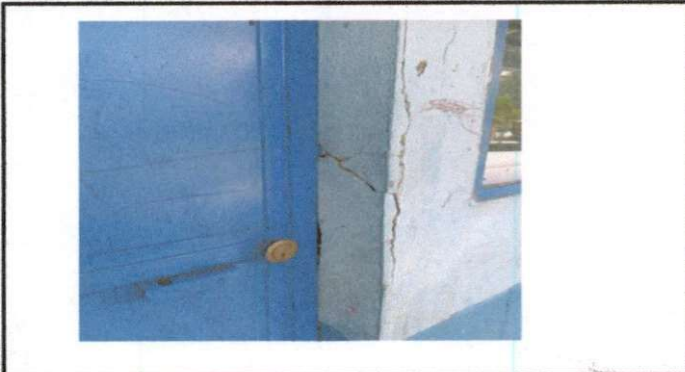
MANTENIMIENTO DE PUERTAS