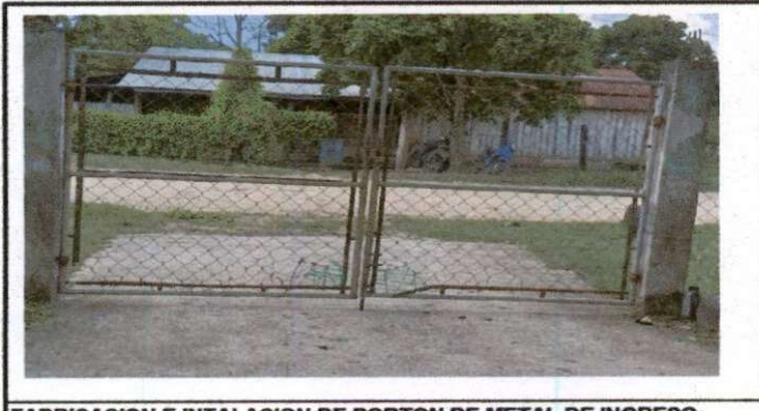
FABRICACION E INTALACION DE PORTON DE METAL DE INGRESO