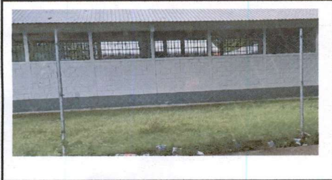
REPARACION DE TUBO HG Y MAYA FALVANIZADA