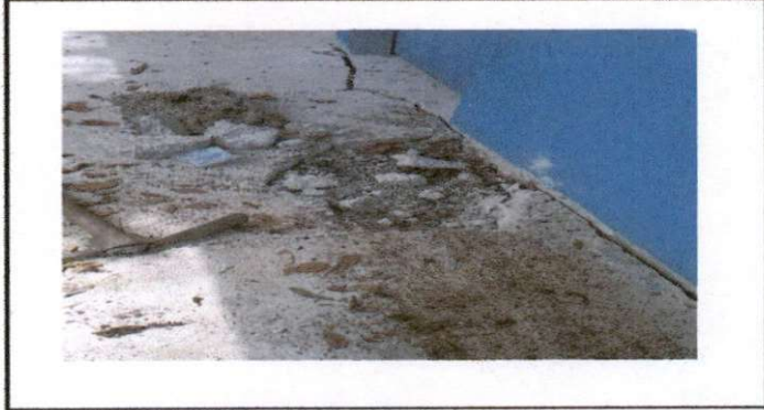
REPARACION DE PLANCHA DE CONCRETO DE PATIO