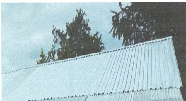
FOTO 3. Sustitución de capote de lámina troquelada