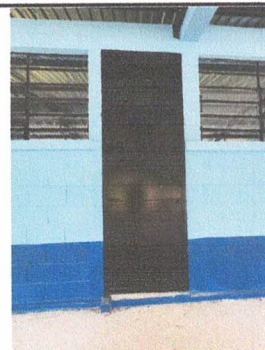
FOTO 6: Mantenimiento a estructura (lijado, cambio de tubo, cepillado, sujeciones, aplicación de pintura)

Observación: Si es necesario se pueden agregar hojas adicionales y actualizar el número de hojas.