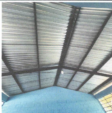
FOTO 1: Sustitución de lámina por lámina troquelada Aluzinc calibre 26