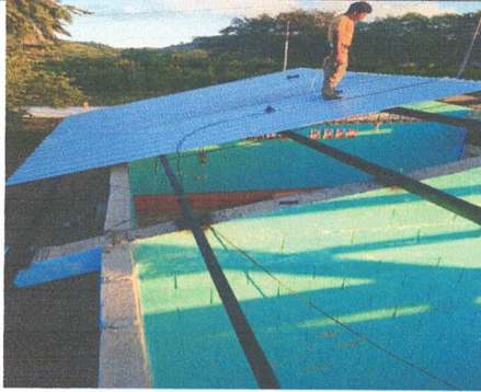
FOTO 1: Sustitución de lámina por lámina troquelada Aluzinc calibre 26