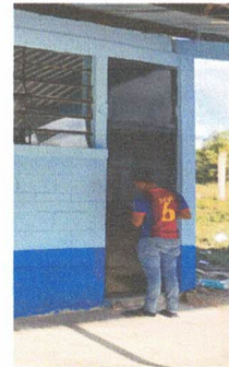
FOTO 6: Mantenimiento a estructura (lijado, cambio de tubo, cepillado, sujeciones, aplicación de pintura)

Observación: Si es necesario se pueden agregar hojas adicionales y actualizar el número de hojas.