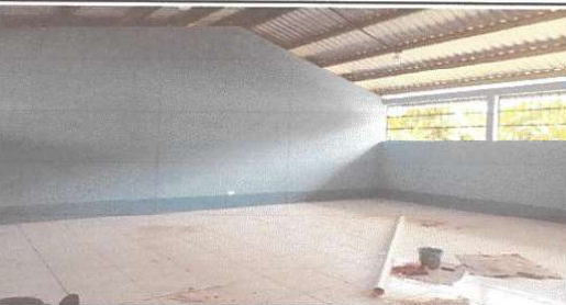
FOTO 4. PINTURA DE INTERIOR Y EXTERIOR