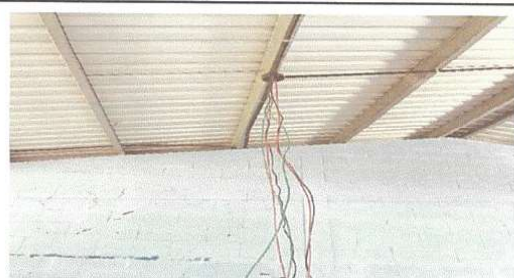
FOTO 2. INSTALACIÓN DE CABLEADO ELECTRICO