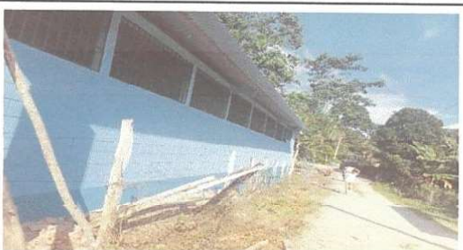
FOTO 4. REPARACIÓN DE CERCO.