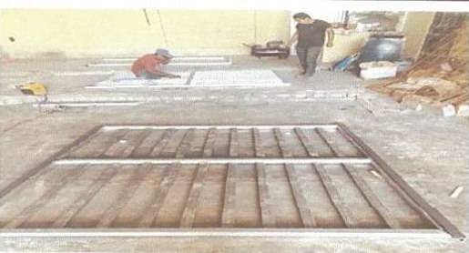
FOTO 3. FABRICACIÓN DE BALCONES