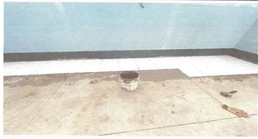
FOTO 1. SUSTITUCIÓN DE PISO CERAMICO