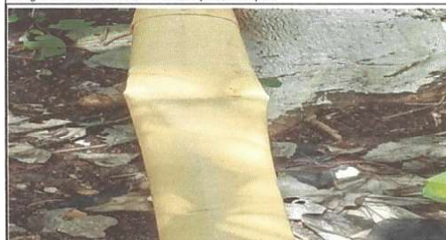
Foto 11 Renglon 7.3 Reparacion de tuberia PVC 3", bajada de agua pluvial

Observación: Si es necesario se pueden agregar hojas adicionales y actualizar el número de páginas.