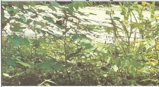
Foto 8. Renglon 15.30 Reparacion de tubo hg y malla galvanizada