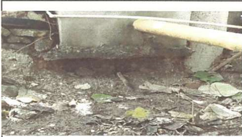
Foto 6: Renglon 14.30 Sustrucion de tuberia PVC linea principal aguas negras