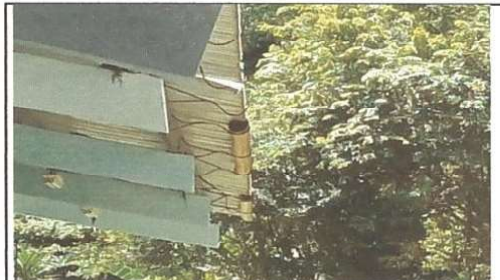
FOTO 09 Renglon 17.30 Sustrucion de lampaas tipo led

Renglon No. 17.50 Sustrucion de plafoneras