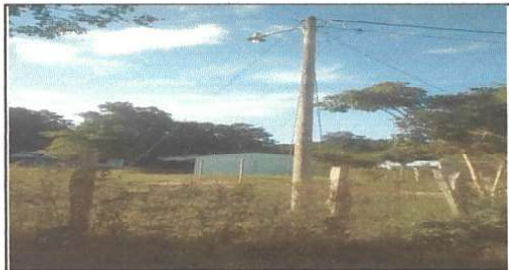
Foto 10 Renglon 19.14 Instalacion de Acometida electrica

Renglon 17.50 Sustrucion de interruptores simples