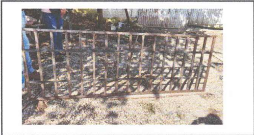
Foto 7: Fabricación e instalación de balcones de hierro en ventana