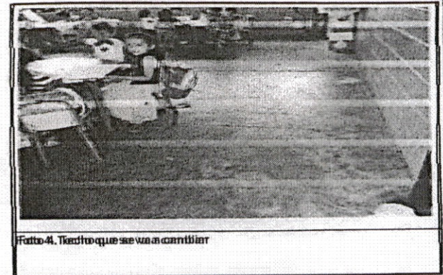
Foto 4. Techo que se va a cambiar