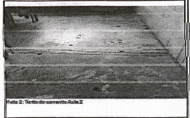
Foto 2. Trota de cemento Aula 2