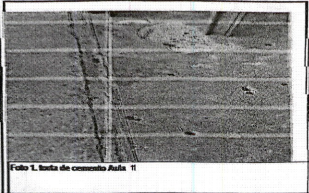
Foto 1. Vista de cemento Aula 1