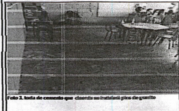
Foto 3. Vista de cemento que durante se instalará pisos de granito