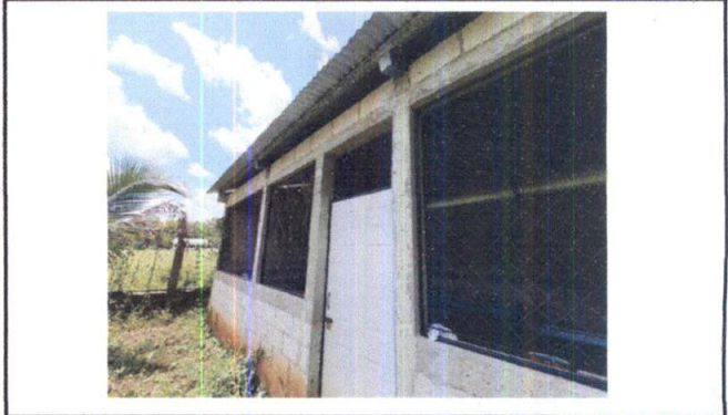
Foto 10: VISTA EXTERIOR DE COCINA, SE EVIDENCIA LA NECESIDAD DE UN PASILLO YA QUE CUANDO LLUEVE EL AGUA INGRESA POR LAS VENTANAS