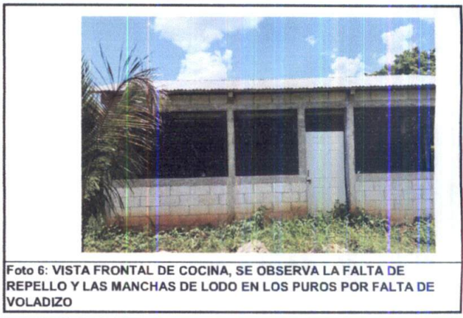
Foto 6: VISTA FRONTAL DE COCINA, SE OBSERVA LA FALTA DE REPELLO Y LAS MANCHAS DE LODO EN LOS PUROS POR FALTA DE VOLADIZO

[Handwritten Signature] Firma y sello del Presidente de la OPF