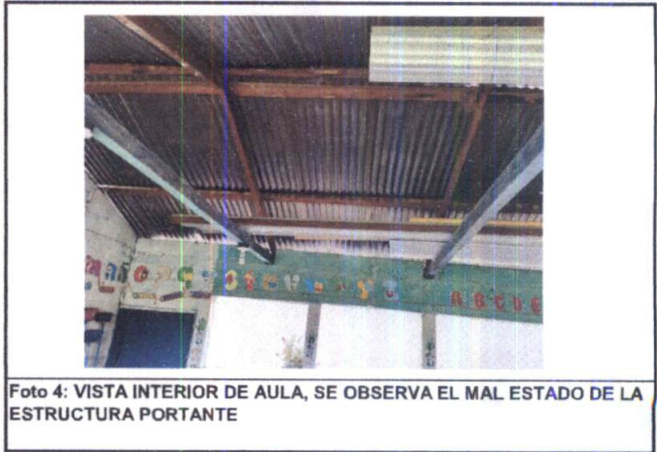
Foto 4: VISTA INTERIOR DE AULA, SE OBSERVA EL MAL ESTADO DE LA ESTRUCTURA PORTANTE