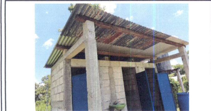
Foto 11: VISTA EXTERIOR DE SANITARIOS, SE OBSERVA EL MAL ESTADO DE LA CUBIERTA