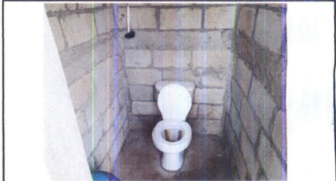
Foto 12: VISTA INTERIOR DE SANITARIOS, SE APRECIA LA FALTA DE AZULEJO EN LOS MUROS

[Firma manuscrita] Firma y sello del Presidente del Comité de Manos Unidas, Sayaxché, Peten