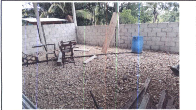
Foto 9: VISTA INTERIOR DE MODULO 1, NO CUENTA CON PISO ADECUADO PARA DAR CLASES