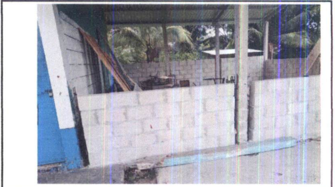
Foto 8: VISTA EXTERIOR DE MODULO 1, SE OBSERVA LA NECESIDAD DE REMOZAMIENTO DE MURO ASÍ COMO DE LA INSTALACIÓN DE BALCONES METÁLICOS