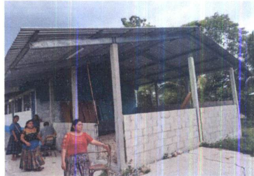
Foto 2: VISTA EXTERIOR DE MODULO 1, SE APRECIA LA FALTA DE REPELLO EN MUROS Y BALCONES EN VENTANALES