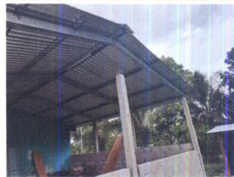
Foto 6: VISTA EXTERIOR DE MODULO 1, SE OBSERVA QUE EL TECHO ESTA DEMASIADO CORTO Y SE METE EL SOL Y LA LLUVIA

CONSEJO EDUCATIVO DE LA ESCUELA OFICIAL DE PARVULOS ANEXA A E.O.R.M. CASERIO SEPUR SAYAXCHE - PETEN