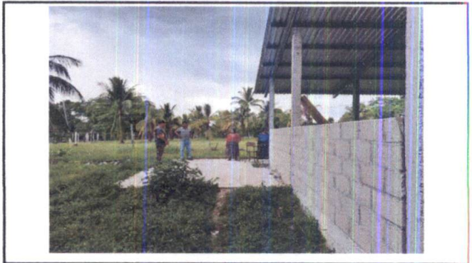
Foto 12: VISTA LATERAL EXTERIOR DE MODULO 1, SE OBSERVA LA NECESIDAD DE LA FUNDICIÓN DE BANQUETA, ASÍ COMO INSTALAR UN VOLADIZO EN LA CUBIERTA