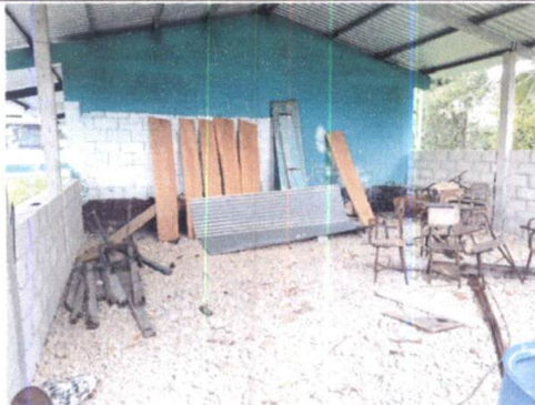
Foto 3: VISTA INTERIOR DE MODULO 1, SE OBSERVA LA FALTA DE PISO DE CONCRETO