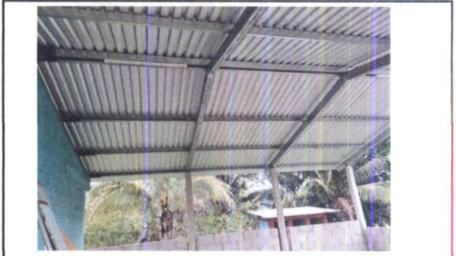
Foto 10: VISTA INTERNA DE MODULO 1, NO TIENE ILUMINACIÓN ELÉCTRICA