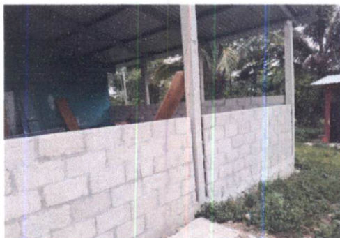
Foto 5: VISTA EXTERIOR DE MODULO 1, SE OBSERVA LA NECESIDAD DE REMOZAMIENTO DE MURO DE BLOCK