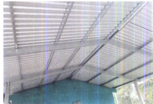
Foto 4: VISTA INTERIOR DE MODULO 1, SE OBSERVA LA FALTA DE ILUMINACIÓN ELÉCTRICA