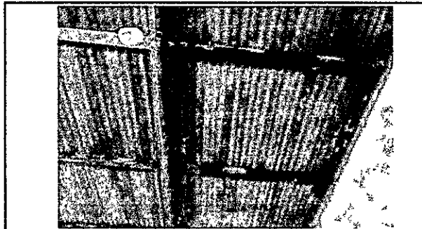
Foto 3: vista interior, se aprecia que algunas plafoneras se encuentran en mal estado