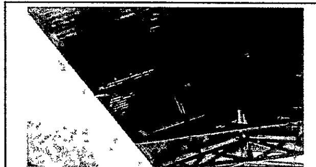
Foto 4: la estructura portante de madera se encuentra en buen estado