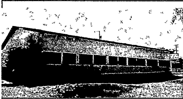
Foto 1: vista lateral del salon de usos multiples del centro educativo que es utilizado tambien como centro de acopio o albergue temporal segun la necesidad