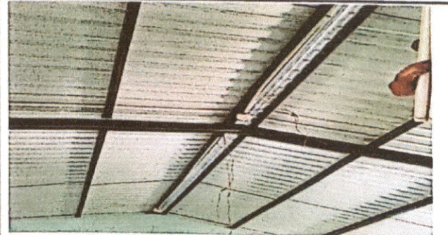
Foto 6: desmonte de lamparas en mal estado e Instalación de nuevas.

Observación: Si es necesario se pueden agregar hojas adicionales y actualizar el número de hojas.