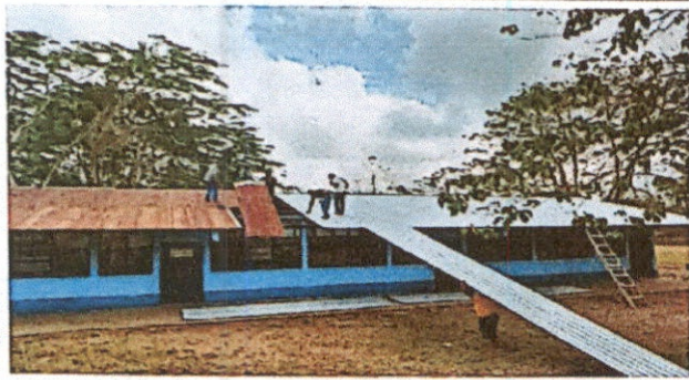
Foto1: Se observa la colocación de láminas nuevas