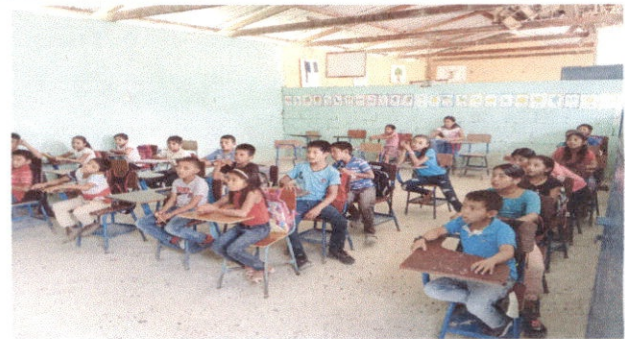
Foto 4: Vista de la otra aula con piso rustico, los cual los niños no pueden trabajar con materiales manipulables.