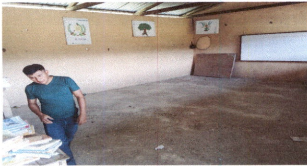
Foto 3: Vista interior de las aulas de piso rustico, se levanta polvason cuando barren lo niños,