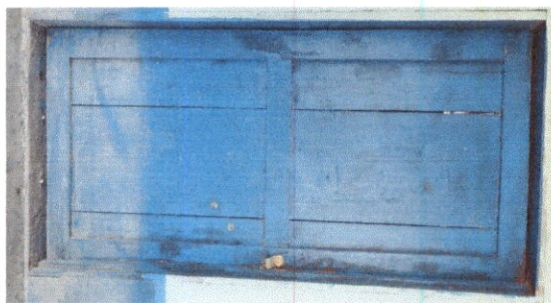
Foto 5: Vista de una de las 4 puertas de madera que se cambiará por metal.