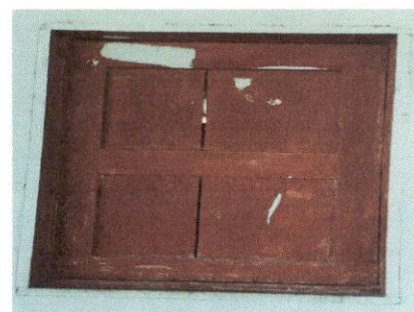
Foto 6: Vista de las 4 ventanas de madera que se cambiará por metal.

Observación: Si es necesario se pueden agregar hojas adicionales y actualizar el número de hojas.