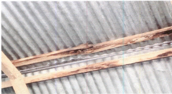
Foto 1: Vista de la parte interior del aula la madera deteriorado y esta callendo por pezados.