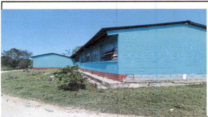
Foto1: Sustitución de vidrios