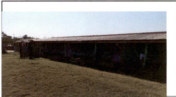
Sustitución de lámina, por lámina troquelada aluziac calibre 26