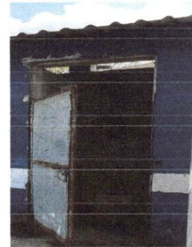
Foto 4: EL TECHO DE LA BATERÍA DE BAÑOS PRESENTA FILTRACIONES Y LAS LETRINAS DE CONCRETO ESTÁN EN MAL ESTADO.