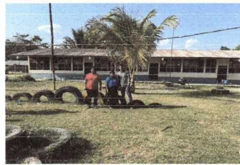
Foto 6: UNA FOTOGRAFÍA CON EL DIRECTOR Y OPF AL CONCLUIR LA VISITA DE CAMPO.