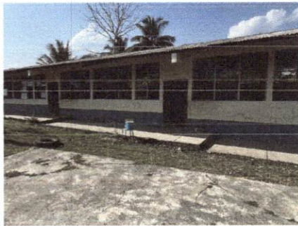
Foto 1: LA FACHADA PRINCIPAL DE LAS AULAS QUE REQUIEREN INTERVENCIÓN.