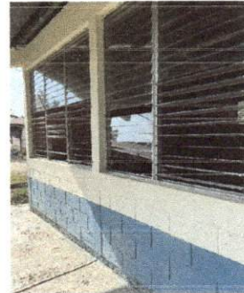
Foto 2: AULA (A, B, C Y D), LOS MARCOS DE LAS VENTANAS MUESTRAN VIDRIOS ROTOS Y EL ALUMINIO ESTÁ DETERIORADO.