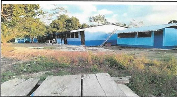
Foto1: Pintura en muros exteriores