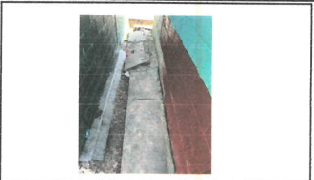
Foto 2: LA BANQUETA DEL AULA (A) MUESTRA DAÑO Y UNA FRACTURA COMPLETA.