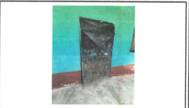
Foto 4: LA PUERTA DEL AULA (A) MUESTRA UN MARCO DETERIORADO Y EVIDENCIA DE CORROSIÓN EN LA PROPIA PUERTA.