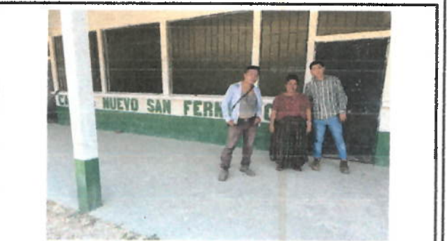
Foto 6: FOTOGRAFIA CON DIRECTOR Y OPF AL TERMINAR VISITA DE CAMPO.