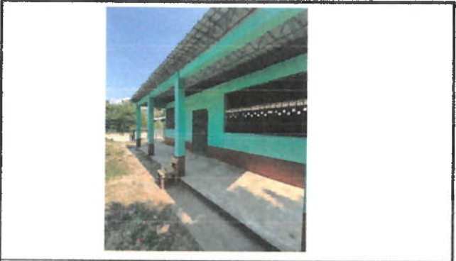
Foto 3: AULA (A), LOS VIDRIOS DE LOS MARCOS DE LAS VENTANAS ESTÁN ROTOS O RAJADOS.