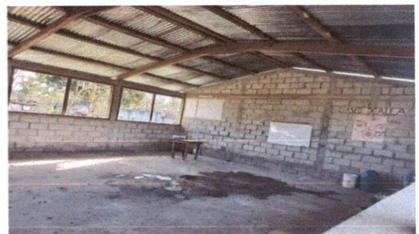
Foto 2: Sustitucion de Estructura de Techo de madera por estructura de metal