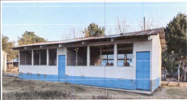
Foto1: Sustitucion de lamina, por lamina troquelada