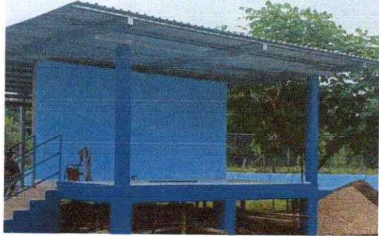
Foto1: Sustitución de lamina, por lámina troquelada aluzin calibre 26.