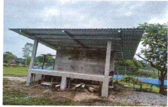
Foto 2: Sustitucion de estructura de soporte de madera por metal.