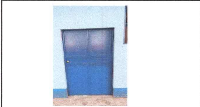
Foto1: SUSTITUCIÓN DE PUERTA