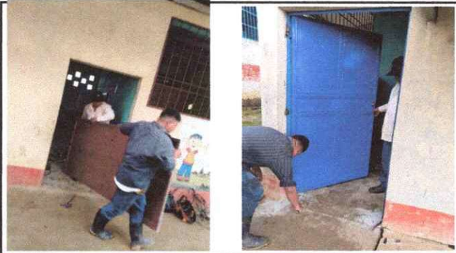
Foto1: SUSTITUCIÓN DE PUERTA