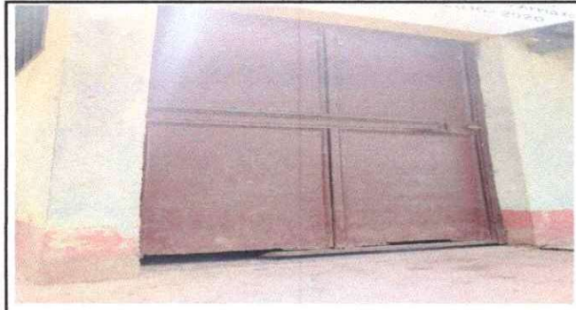
Foto1: SUSTITUCIÓN DE PUERTA