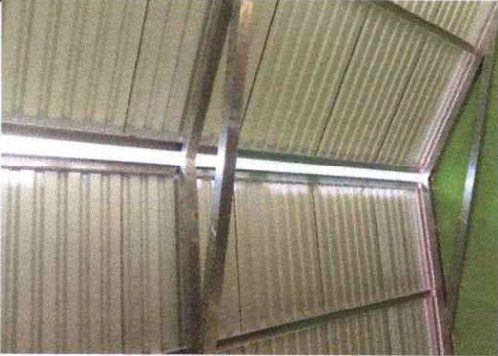
Foto1: Sustitución de lamina por lamina troquelada calibre 26