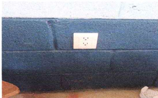
Foto1: Sustitución de tomacorrientes dobles.

Observación: Si es necesario se pueden agregar hojas adicionales y actualizar el número de hojas.