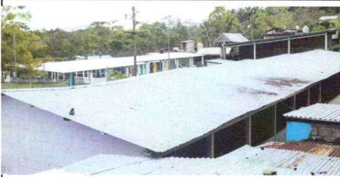
Foto 1: Sustitución de lámina, por lámina troquelada aluzinc calibre 26