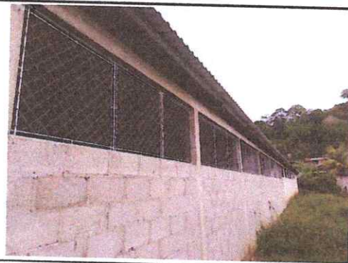
Foto 6: Balcones instaladas en la parte trasera de las aulas construidas.

Observación: Si es necesario se pueden agregar hojas adicionales y actualizar el número de hojas.