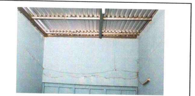
Foto 17 sellado de grietas y fisuras en muros

Observación: Si es necesario se pueden agregar hojas adicionales y actualizar el número de hojas.