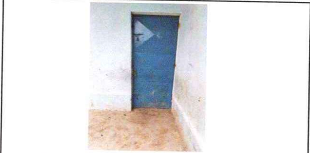
Foto 13: Mantenimiento de estructura (lijado, cepillado, sujeciones, aplicacion de pintura)