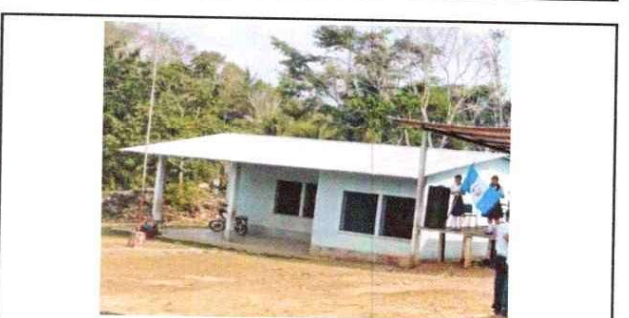
16 pintura de muro exterior e interior