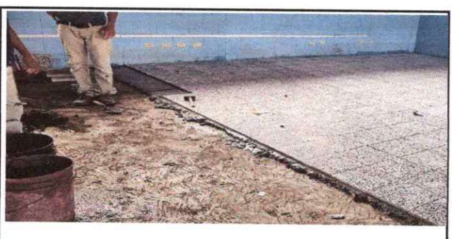
Foto 6: sustitución de piso de torta de concreto por piso de granito

Observación: Si es necesario se pueden agregar hojas adicionales y actualizar el número de hojas.