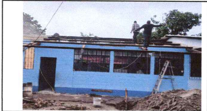
Foto1: sustitución de lamina por lamina troquelada aluzinc calibre 26