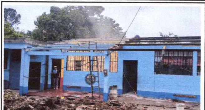
Foto 2: sustitución lamina por lamina troquelada aluzinc calibre 26