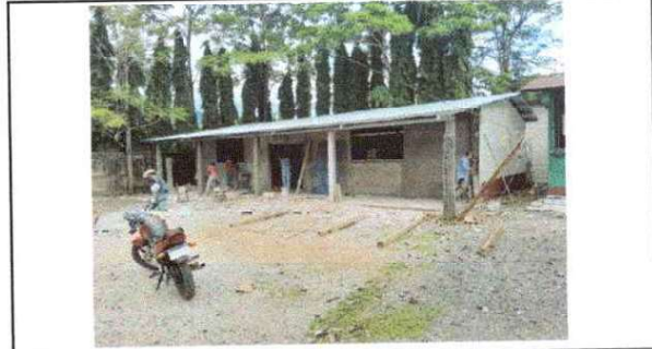
Foto 4: Sustitución de lamina por lamina troquelada aluzinc calibre 26