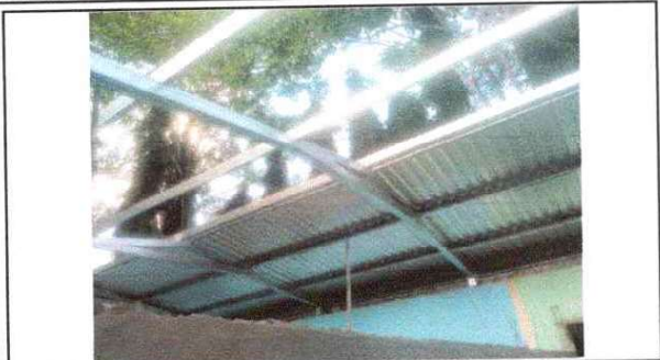
Foto 1: Sustitucion de estructura de soporte de madera por metal.