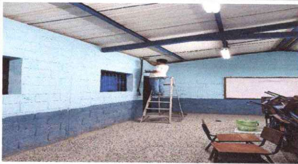
FOTO 9. PINTURA EXTERIOR E INTERIOR

Observación: Si es necesario se pueden agregar hojas adicionales y actualizar el número de hojas.