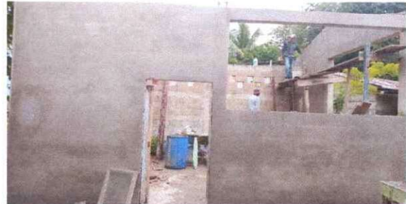
FOTO 6. CERNIDO EN MURO

Observación: Si es necesario se pueden agregar hojas adicionales y actualizar el número de hojas.