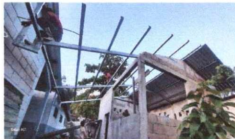
FOTO 2. INSTALACION DE LAMINA TROQUELADA ALUCINC CALIBRE 26