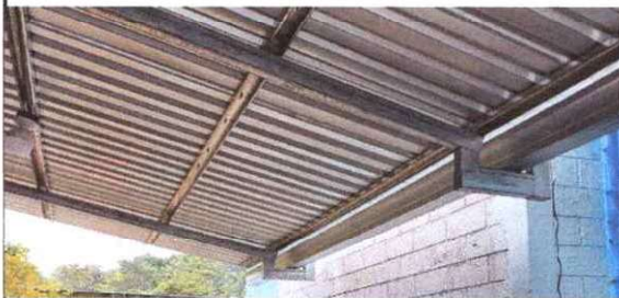
FOTO 5. INSTALACION DE CANAL