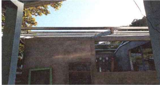
FOTO 1. INSTALACION DE ESTRUCTURA DE SOPORTE DE METAL