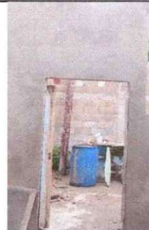
FOTO 4. SUSTITUCION DE PUERTA