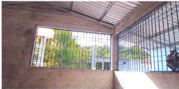
FOTO 3. INSTALACION DE BALCON