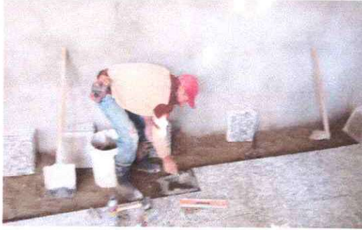
FOTO 7. SUSTITUCION DE PISO DE GRANITO