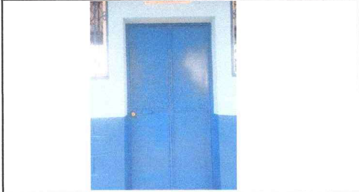
FOTO 1: Mantenimiento a estructura (lijado, cambio de tubo, cepillado, sujeciones, aplicación de pintura)