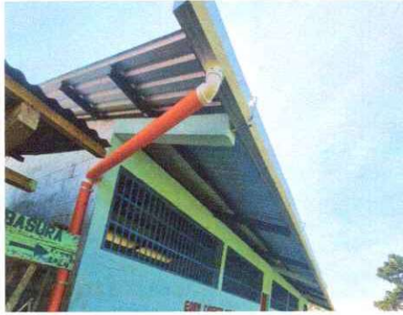
Foto1: Sustitución de lámina, por lámina troquelada aluzinc calibre 26