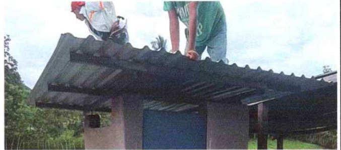
Foto 2: Sustitución de estructura de soporte de madera, por metal