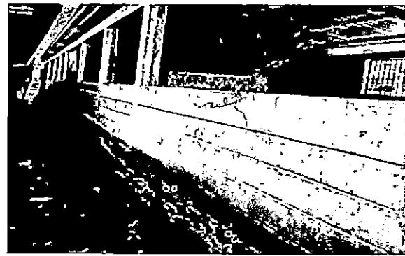
Foto 4 Sustitucion de ventanas y balcones.