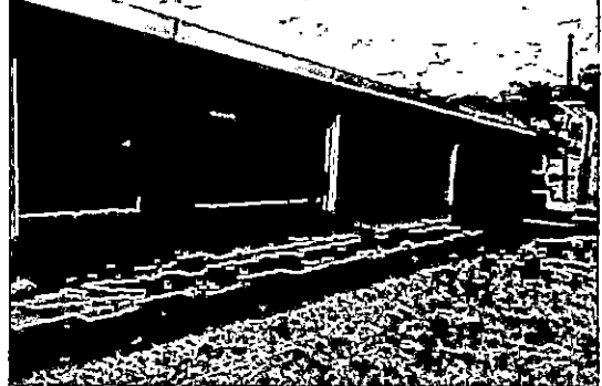
Foto 2 Sustitucion de torta de concreto y piso de corredor.