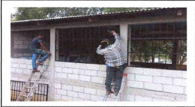
Foto1: Sustitución de balcones en aulas