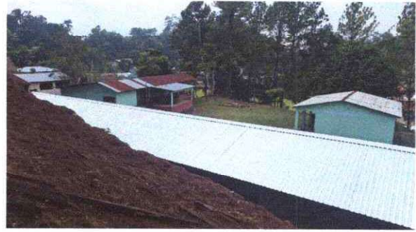
Foto 4: Sustitucion de capote de lámina para lámina troquelada aluzin calibre 26.