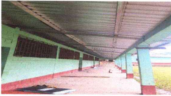
Foto1: Sustitución de estructura de soporte de madera, por metal