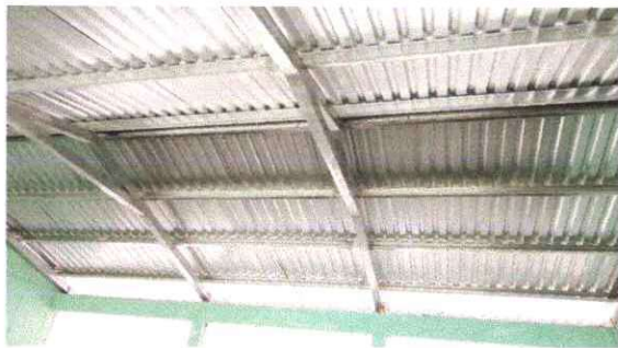
Foto 5: Sustitución de estructura de soporte de madera, por metal.