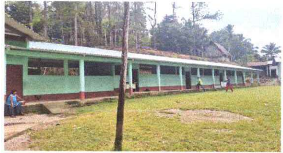
Foto 2: Sustitucion de lámina, por lámina troquelada aluzin, calibre 26.