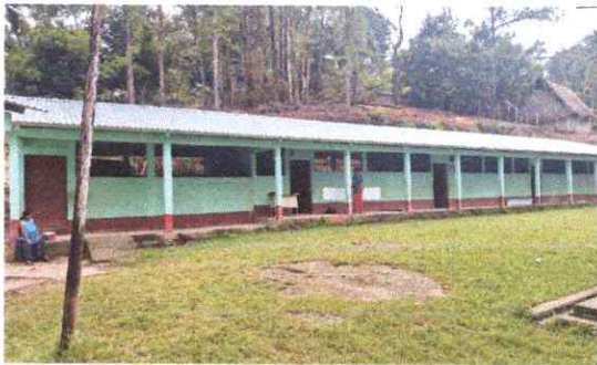
Foto 3: Sustitucion de lámina, por lámina troquelada aluzin, calibre 26.