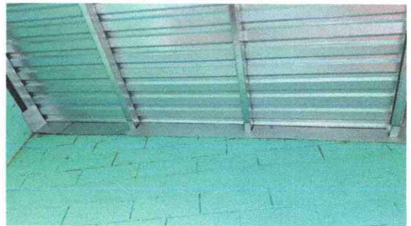
Foto 6: Sustitución de estructura de soporte de madera, por metal.

Observación: Si es necesario se pueden agregar hojas adicionales y actualizar el número de hojas.