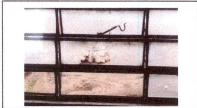
Foto1: Sustrucción de balcones de metal