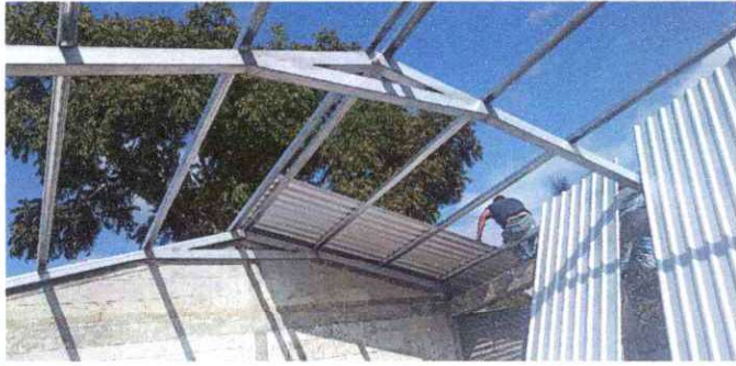
Foto1: Cambio de lámina.