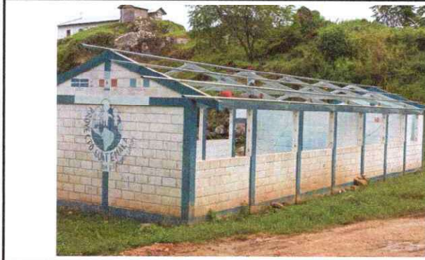
Foto1: Sustitución de lámina, por lámina troquelada aluzinc c