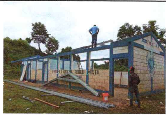
Foto 2: Sustitución de estructura de soporte de madera, por metal