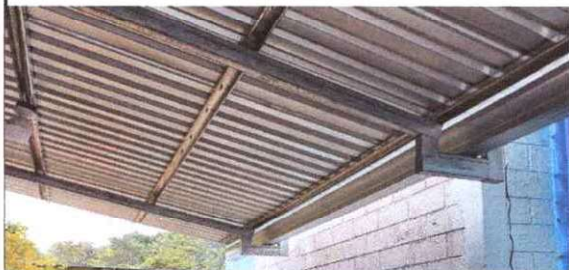
FOTO 5. INSTALACION DE CANAL