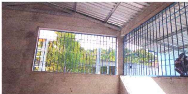
FOTO 3. INSTALACION DE BALCON