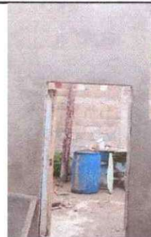
FOTO 4. SUSTITUCION DE PUERTA