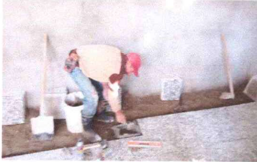
FOTO 7. SUSTITUCION DE PISO DE GRANITO