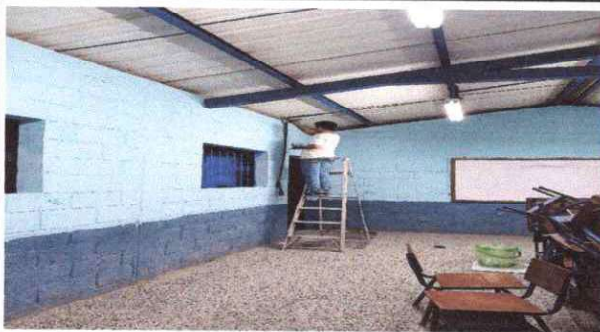
FOTO 9. PINTURA EXTERIOR E INTERIOR

Observación: Si es necesario se pueden agregar hojas adicionales y actualizar el número de hojas.