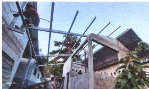
FOTO 2. INSTALACION DE LAMINA TROQUELADA ALUCINC CALIBRE 26