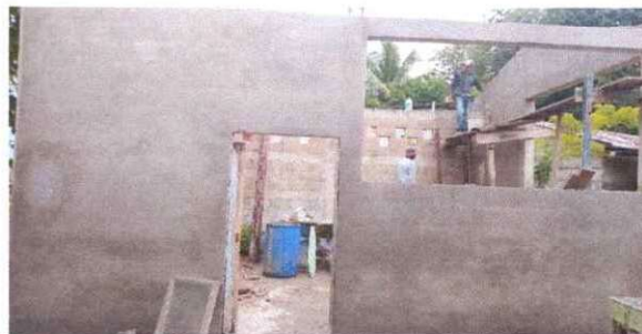
FOTO 6. CERNIDO EN MURO

Observación: Si es necesario se pueden agregar hojas adicionales y actualizar el número de hojas.