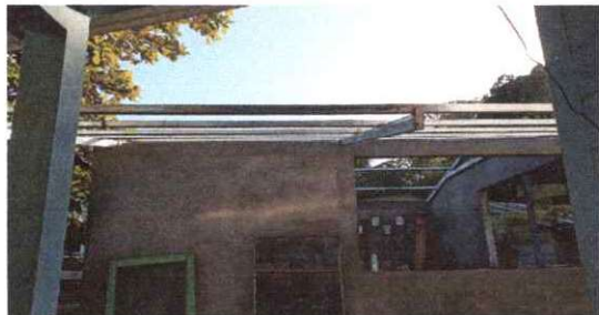
FOTO 1. INSTALACION DE ESTRUCTURA DE SOPORTE DE METAL