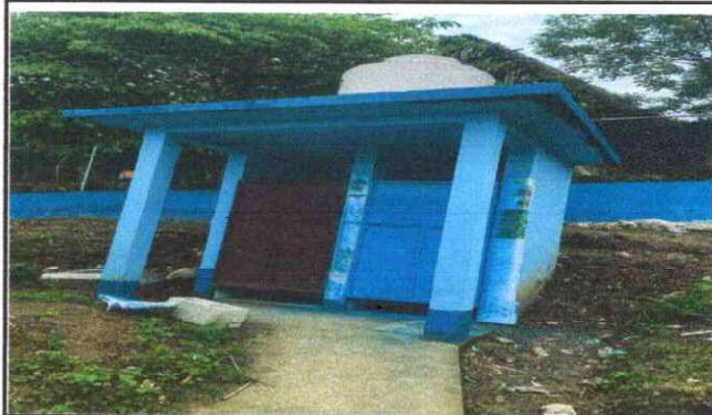
Foto 11:MANTENIMIENTO A ESTRUCTURA ( CEPILLADO Y APLICACIÓN DE PINTURA)

Observación: Si es necesario se pueden agregar hojas adicionales y actualizar el número de hojas.