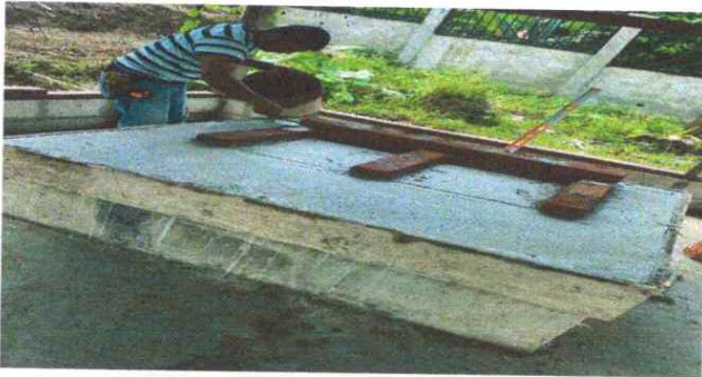
Foto1: MANTENIMIENTO A ESTUFA RURAL