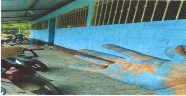
Foto7: PINTURA MUROS INTERIOR Y EXTERIOR