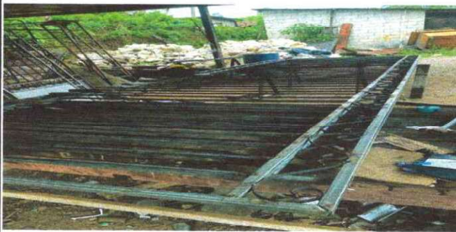
Foto11:SUSTITUCION DE BALCONES DE METAL