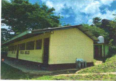
Foto7: PINTURA MUROS INTERIOR Y EXTERIOR