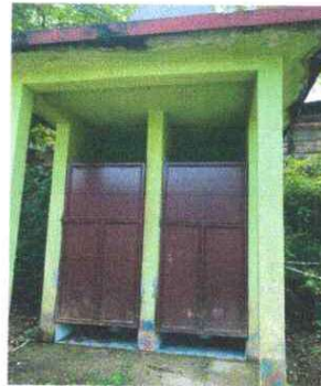
Foto 11:MANTENIMIENTO A ESTRUCTURA ( CEPILLADO Y APLICACIÓN DE PINTURA)

Observación: Si es necesario se pueden agregar hojas adicionales y actualizar el número de hojas.