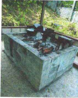
Foto1: MANTENIMIENTO A ESTUFA RURAL