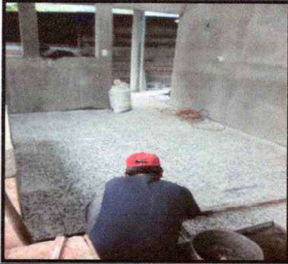
Foto7: Reparación de piso de granito en cocina