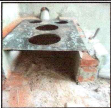
Foto 25: Sustitución de estufa rural completa (plancha y chimenea)