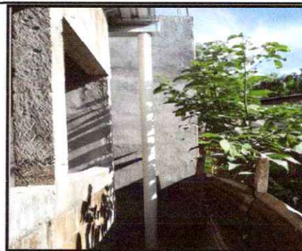
Foto 18: Sustrucción de bajada de agua pluvial de metal por tubo PVC 3"

Observación: Si es necesario se pueden agregar hojas adicionales y actualizar el número de hojas.