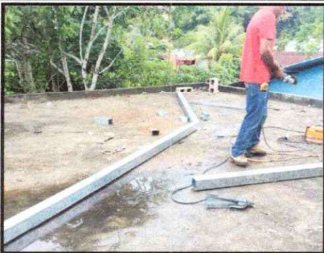
Foto 3: Sustitución de estructura de soporte de madera, por metal