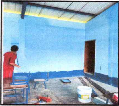
Foto 19: Aplicación de pintura en paredes interiores y exteriores