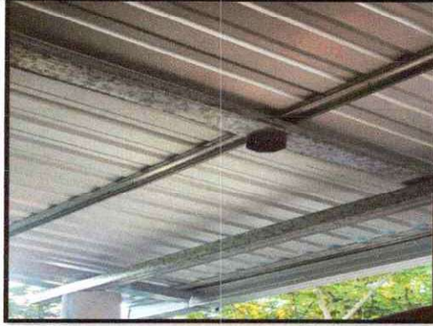
Foto1: Sustitución de lámina por lámina troquelada aluzinc calibre 26 en en cocina