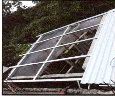
Foto 14: Sustrucción de estructura de soporte de madera por metal en baño y bodega