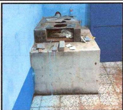
Foto 27: Sustitución de azulejo en estufa rural completa (plancha y chimenea)