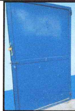
Foto 16: Mantenimiento a estructura de metal, (lijado y aplicación de pintura en puerta de baños)