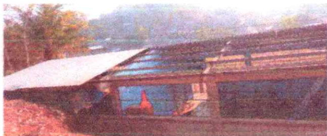
Foto1: Desintalación de lámina, para luego realizar mantenimiento a estructura, lijado y pintado.