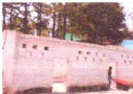
Foto 2: Desintalación de estructura y lamina, apertura de espacio para colocar ventana.