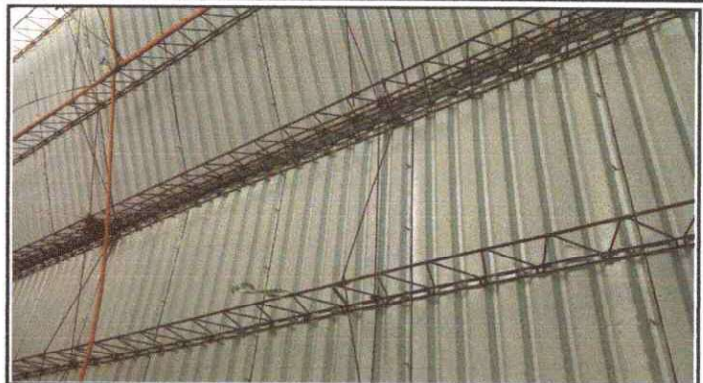
Foto 2: Sustitución de estructura de soporte de metal, por metal.