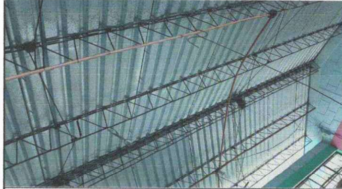
Foto 1: Sustitución de lámina, por lámina troquelada aluzinc calibre 26.