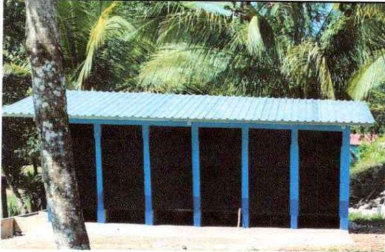
Foto1: Reparación de Estructura del baño y pintura y torta de cemento